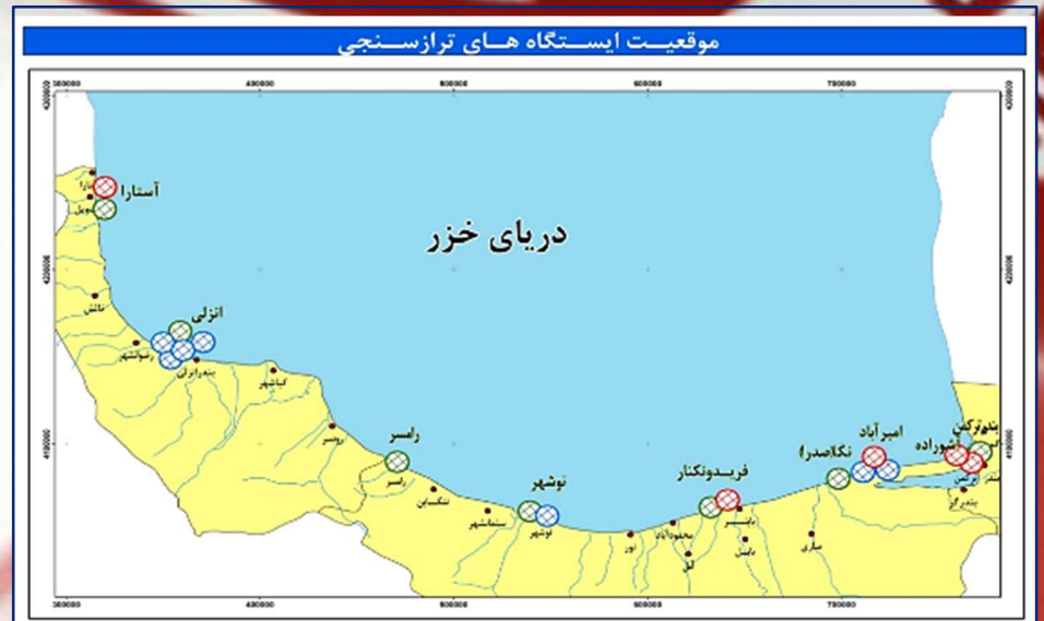
شکل ۲- نظارت بر امر آماربرداری و اخذ، پردازش و ذخیره‌سازی داده‌های ایستگاه‌های ترازسنجی فعال سواحل جنوبی دریای خزر