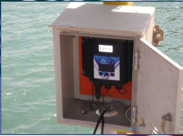
شکل ۱- ایستگاه‌های اندازه‌گیری تراز آب