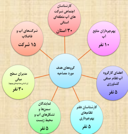
شکل- تعداد افراد مصاحبه شده در هر گروه

تدوین نقشه راه مطالعات اجتماعی آب کشور با هدف شناسایی مسائل اجتماعی آب، با ابلاغ وزارت نیرو در سال ۱۳۹۷ در موسسه تحقیقات آب انجام شد. برای شناسایی مسائل اجتماعی علاوه بر بررسی اسناد بالادستی و برنامه‌های توسعه بعد از انقلاب، با استفاده از رویکرد کیفی، برای فهم وضعیت موجود، وضعیت مطلوب و راهبردها به مصاحبه با بیش از ۱۰۰ متخصص اجتماعی آب در سرتاسر کشور پرداخته شد که پراکندگی نمونه نشان داده شده است.