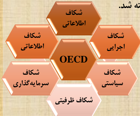
شکل- مدل شکاف حکمرانی آب

مدل تحلیل مسائل اجتماعی آب در کشور بر پایه مدل OECD و شکاف‌های تعریف شده در این مدل برای شناسایی وضع موجود در نظر گرفته شد.